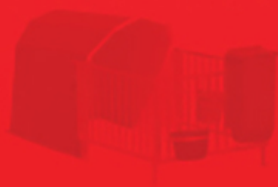
Box in vetroresina Fiberglass box for calves