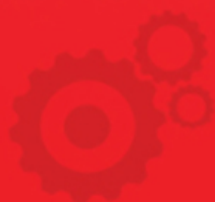
Altri prodotti Other Products