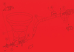
Coclee Screw conveyors