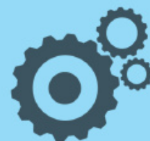
Altri prodotti Other Products