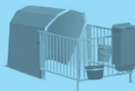
Box in vetroresina Fiberglass box for calves