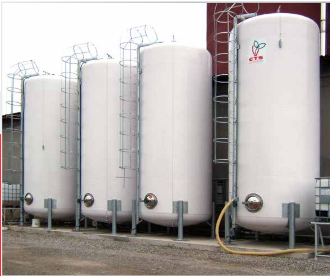
CISTERNE PER LIQUIDI - Tanks For Liquids