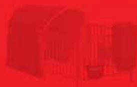
Box in vetroresina